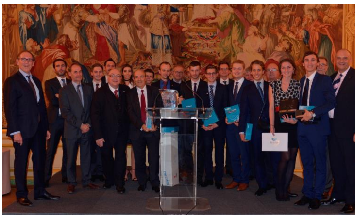
Cérémonie de remise des prix avec Eric Trappier, PDG de Dassault Aviation Vendredi 25 novembre 2016